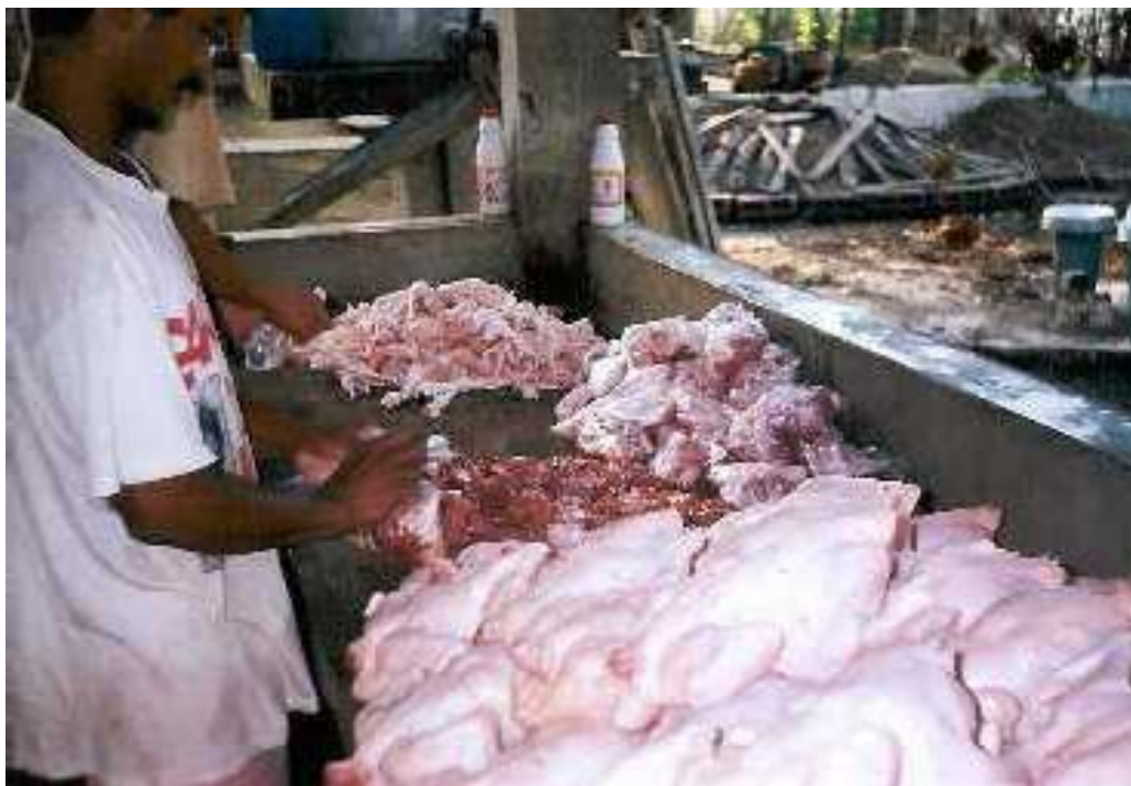
Foto 5. Rendimiento en canal