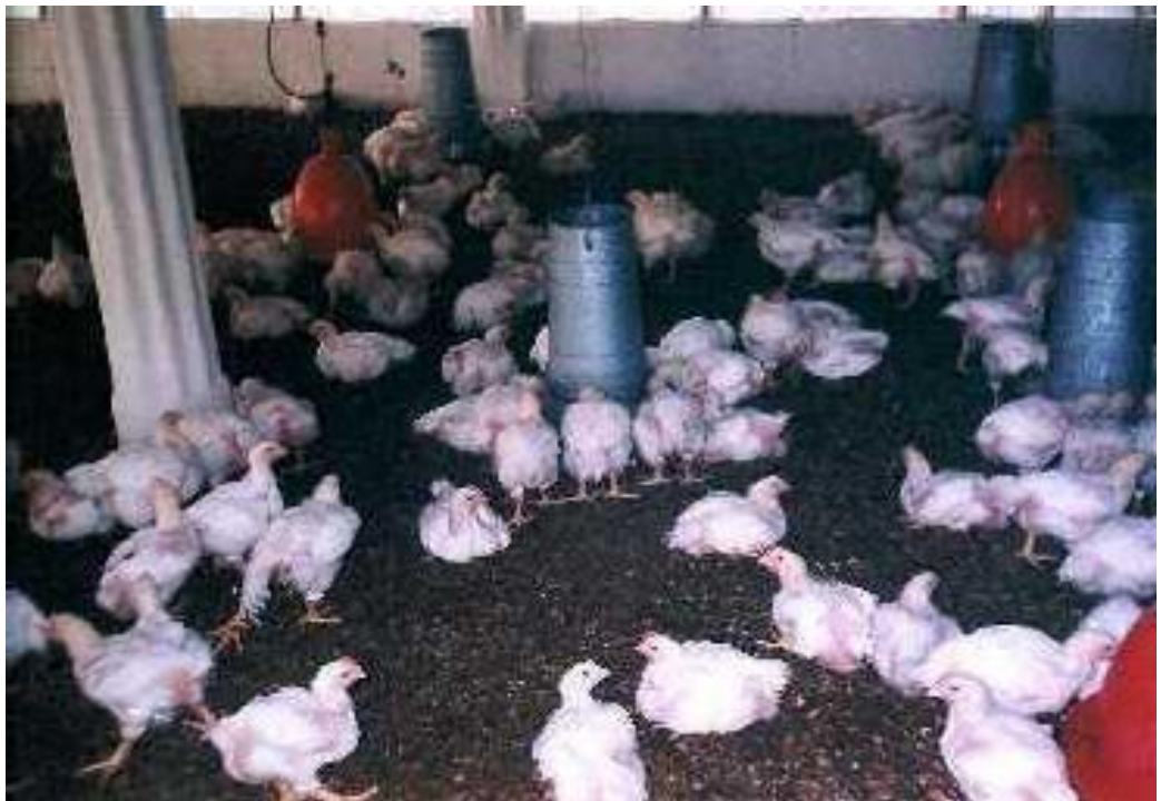
Foto 3. Distribución de comederos y bebederos