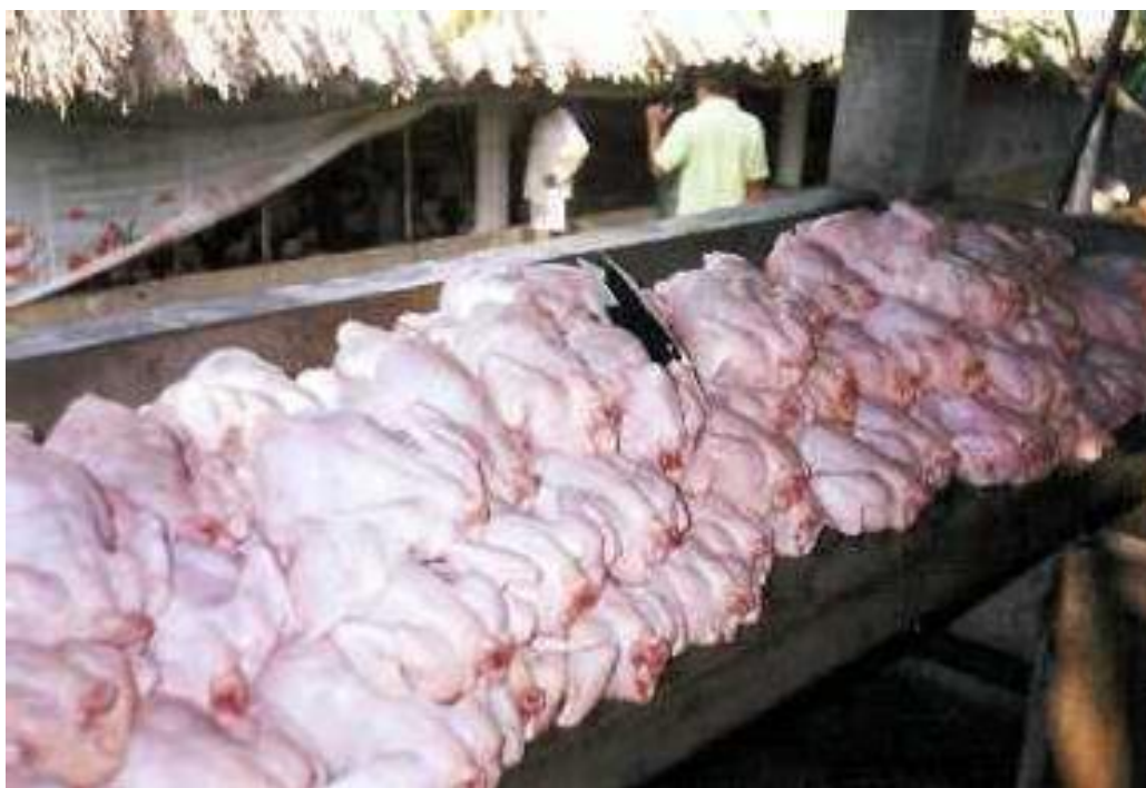
Foto 6. Rendimiento en canal.