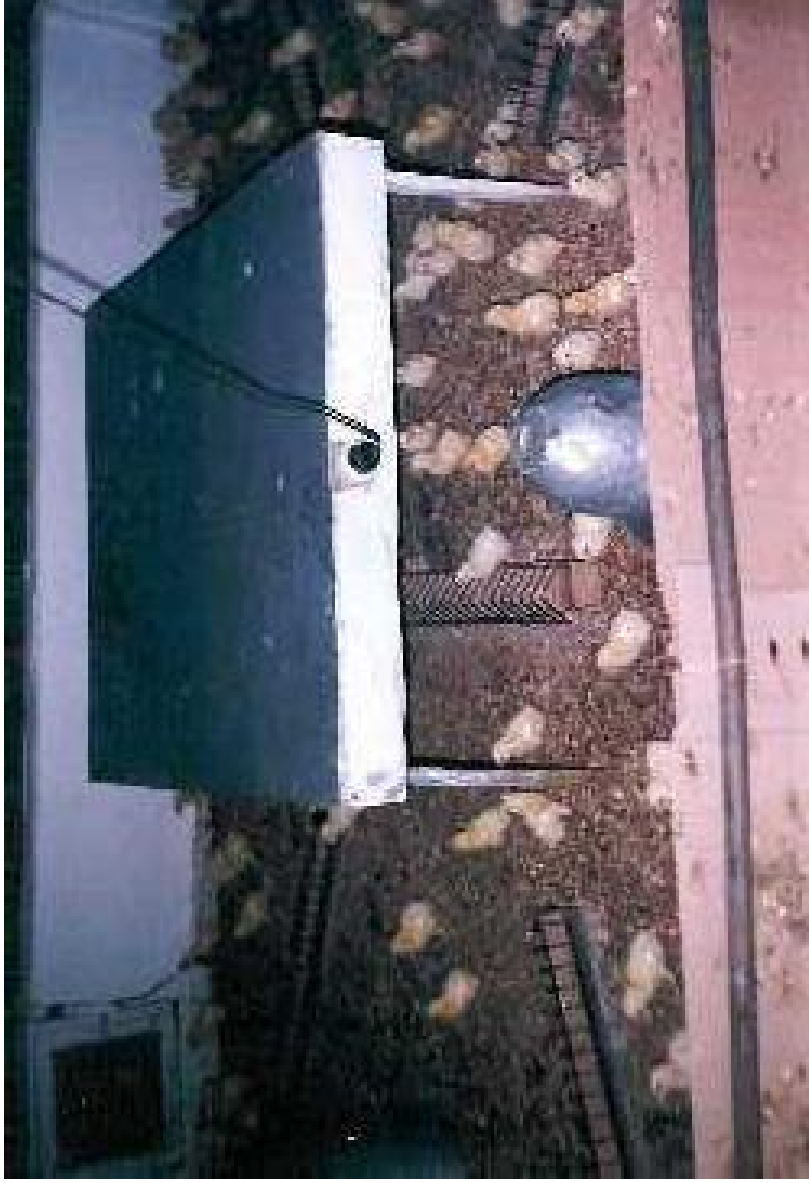
Foto 1. Criadora