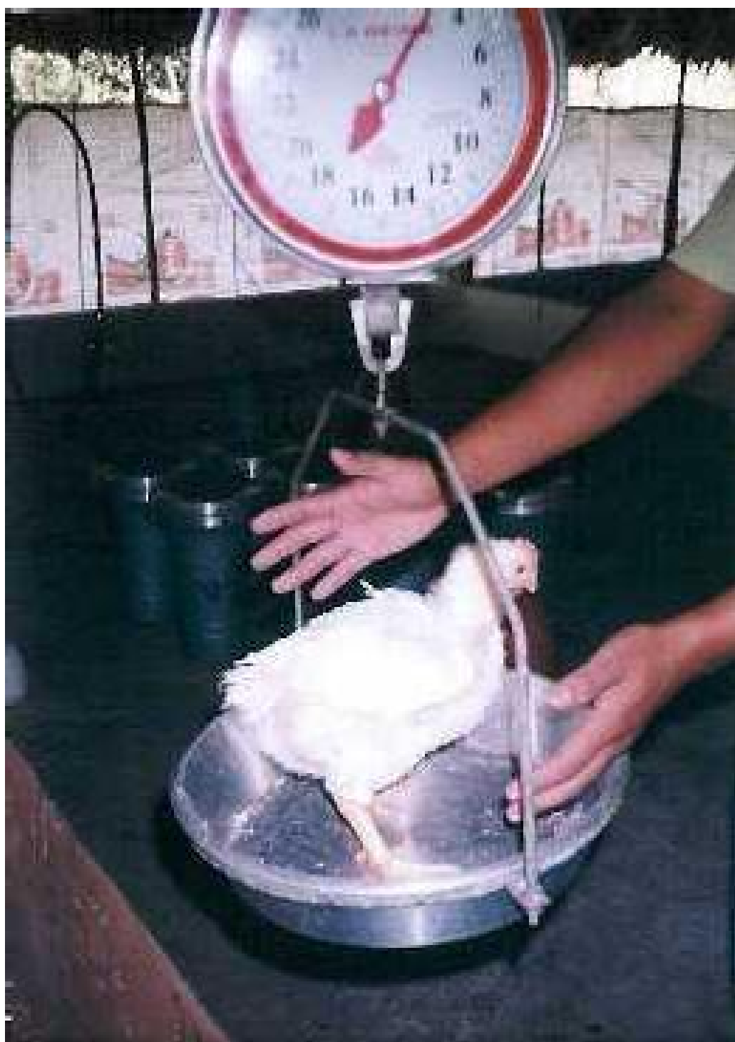
Foto 4. Pesaje.