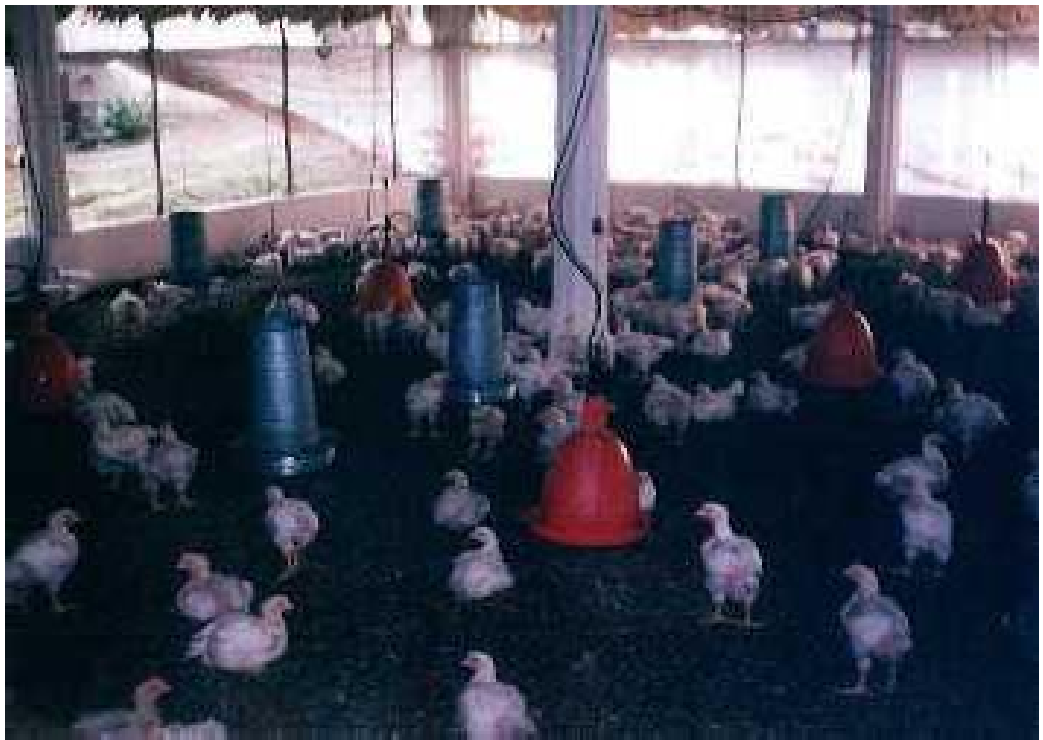
Foto 2. Distribución de comederos y bebederos